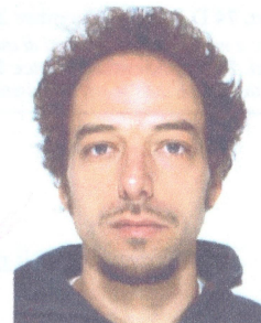
Dichiarazione d'identità personale [Ex art.651 c.p.] ATTO ESTERO PRODUCIBILE IN GIUDIZIO Prot. Interno: AddT 06051985 006/2018